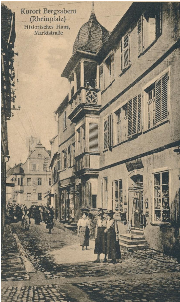
Die damalige Mittelgasse, heute Marktstraße, um 1900