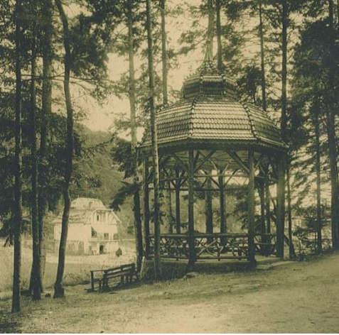
Der Musikpavillon am Philosophenweg

Damals entstand im Kurtal das erste Kurhaus. Georg Holler, Eigentümer einer Wappenschmiede und Mahlmühle, hatte als erster die Zeichen der Zeit erkannt und zunächst einige Zimmer für Sommerfrischler aus Ludwigshafen und Speyer eingerichtet. 1886 baute er sein Haus zu einem „Kurhaus“ um, das er wegen der großen Nachfrage zu einer Pension mit 60 Zimmern erweiterte.