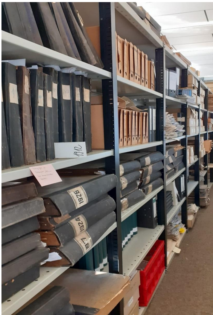
Auch alte Zeitungen kann man im Verbandsgemeindearchiv einsehen

(1.600 Nummern in 62 Archivkartons), Thesaurus und Zeitgeschichtliche Sammlung (Pressearchiv, seit 1989 durchgehend), die Archivbibliothek (mehr als 1.000 Bände) und die Plansammlung (ca. 300 Karten und Pläne).