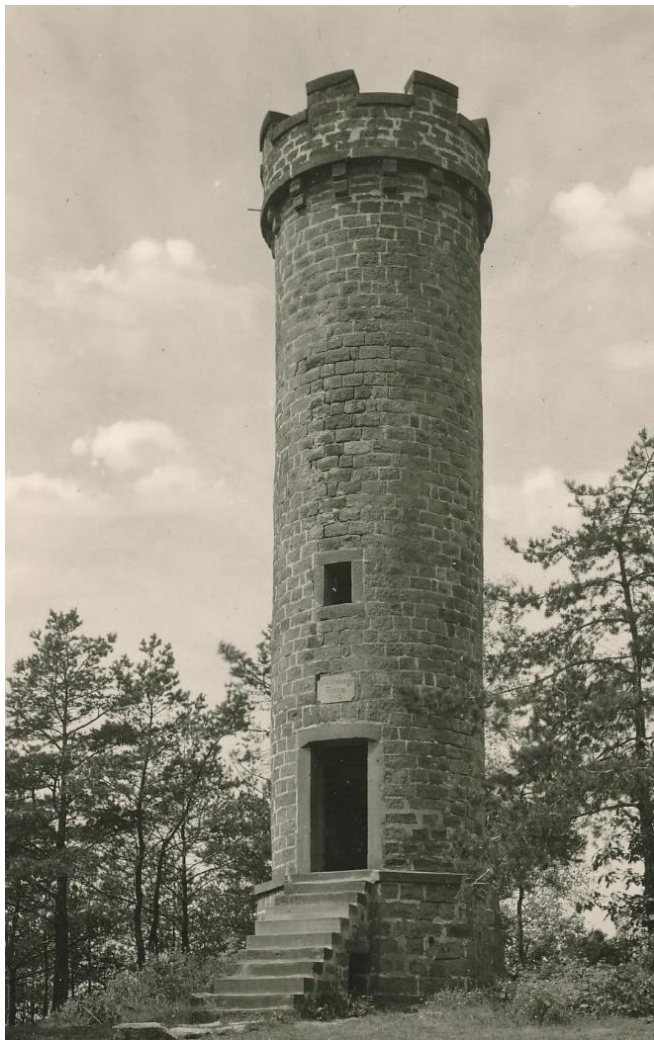
Der 1897 eingeweihte, erste Staffelsbergturm