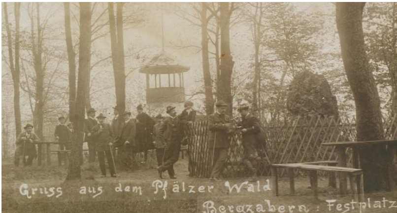
Um 1900 luden Festplatz und Pavillon zur Rast ein. Heute steht an dieser Stelle der Bismarckturm