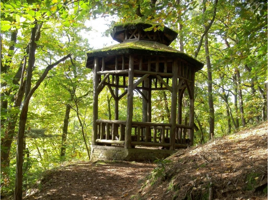
Der nach Wilhelm Kessler, dem Vorsitzenden des Verschönerungsvereins benannte Wilhelmspavillon

1900 stirbt Tischberher im Alter von 40 Jahren. Am 24. August des gleichen Jahres wird der Kneipp-Verein, Sektion Bergzabern, beim Amtsgericht Landau unter der Register-Nummer VR 519 ins Vereinsregister eingetragen.